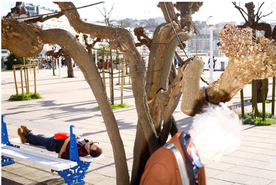
Los tamarindos de La Concha, 2024