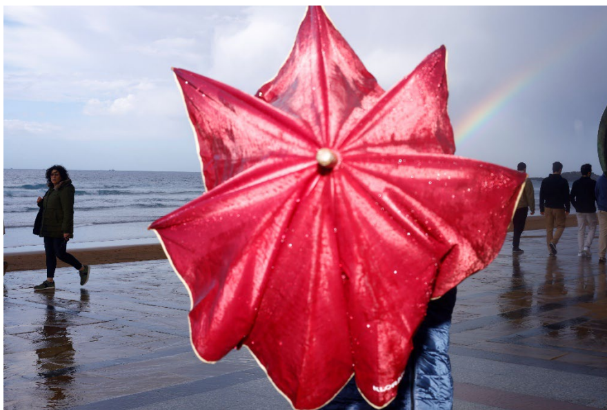
Paraguas y flores, 2024

Su tarea consiste en crear un inventario, recomponer una imagen cotidiana y hacer un ejercicio de representación que haga mirar las cosas de manera crítica a los propios pobladores de ese paisaje.