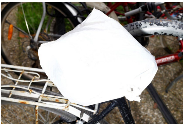
Bolsas de plástico en sillines de bici, 2024

La selección que hace de las formas viene determinada por la utilización de ciertos elementos como símbolos de identidad. Si los cítricos o las paellas le han servido en Valencia como signo de lo levantino, en San Sebastián son las Bolsas de plástico en sillines de bici o los paraguas de la serie Paraguas y flores los que le permiten contar los rasgos identitarios de la comunidad.