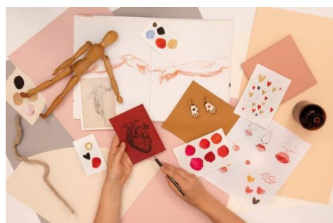
Arriba izq.: taller Woodmorning, a la dcha.: Materia Rica; abajo izq.: Corrie Bain School y a la dcha Escola d'Art La Industrial