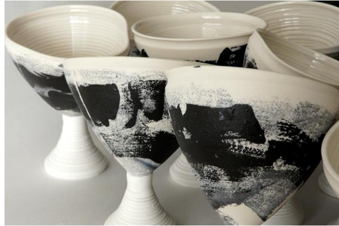
Piezas úniques de Litoràmica a la izquierda y Elomi ceràmica a la derecha.