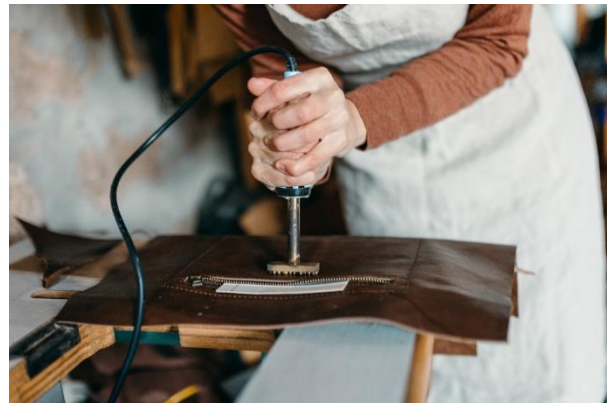
Izq.: Lar Nature en La Torre de Claramunt. Dcha.: Nubuckcuir en Òdena