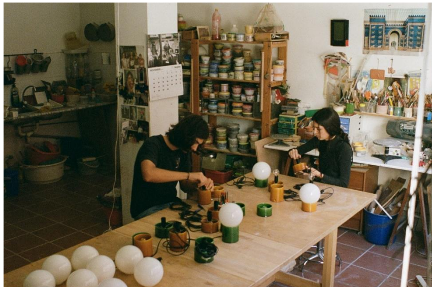
Estudio de Núria Carrascal

La A-FAD estima que en cada edición visitan algún espacio de Tallers Oberts Bcn + L'H + l'Anoia alrededor de unas 10.000 personas. La presidenta de la A-FAD, Carol Fleischman reivindica edición tras edición “la necesidad de la existencia de talleres como espacios de cultura para fortalecer el vínculo entre la ciudadanía y el entramado creativo local. La transmisión de conocimientos milenarios y a veces con riesgo de perder su continuidad, nos hace dar cuenta de la importancia de reivindicar este tejido profesional.”