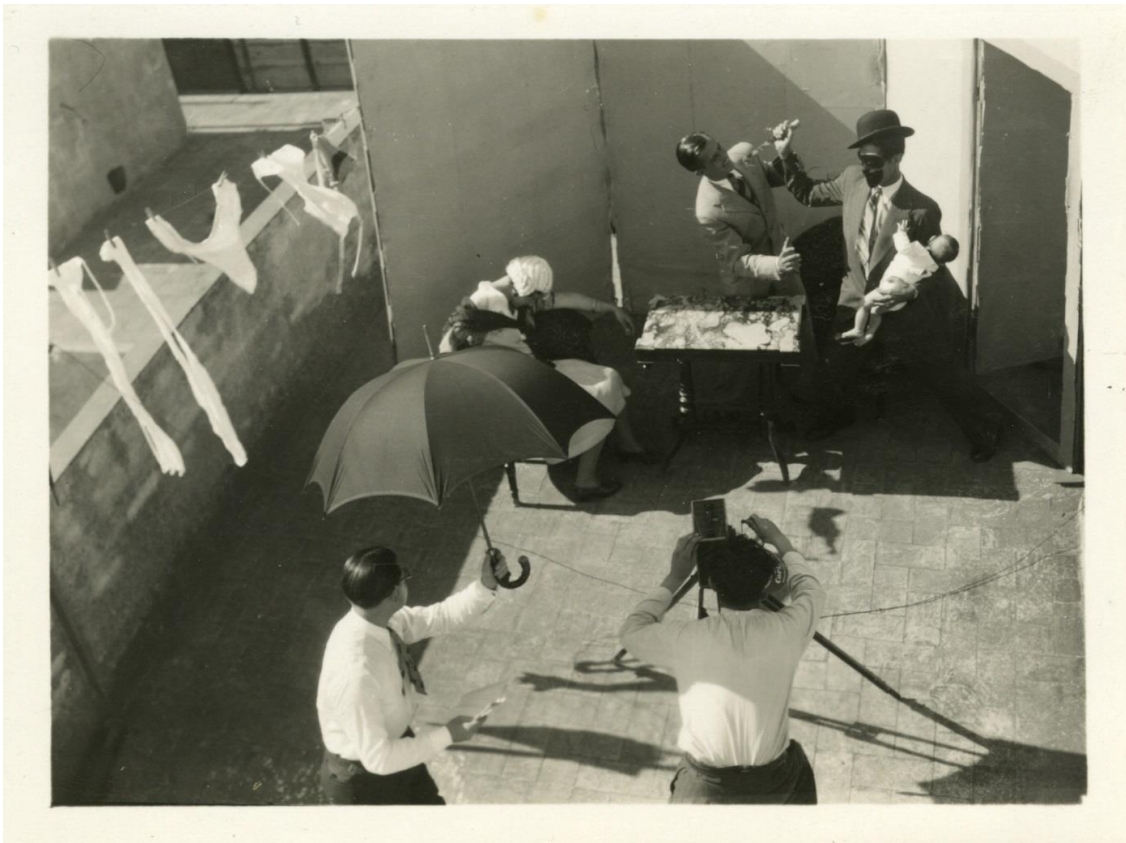
Rodatge en un terrat. Foto de Pilar de Quadras. Arxiu Família Quadras

Per poder donar visibilitat a tots aquests materials, i d'acord a la legislació actual, s'ha procedit a localitzar i contactar als hereus i legítics propietaris dels drets, per tal d'establir convenis i contractes de cessió per a usos culturals, i així poder fer una comunicació pública d'acord als objectius de la FilmoTeca de difusió del patrimoni cinematogràfic.